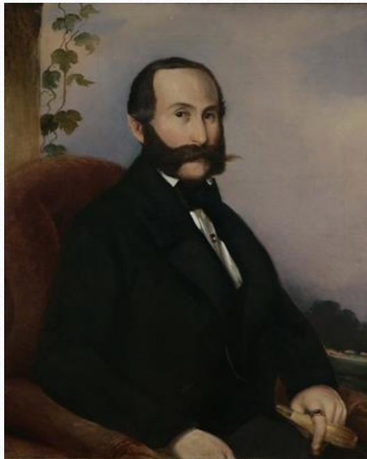
Ivan Rendić (1849.-1932.)