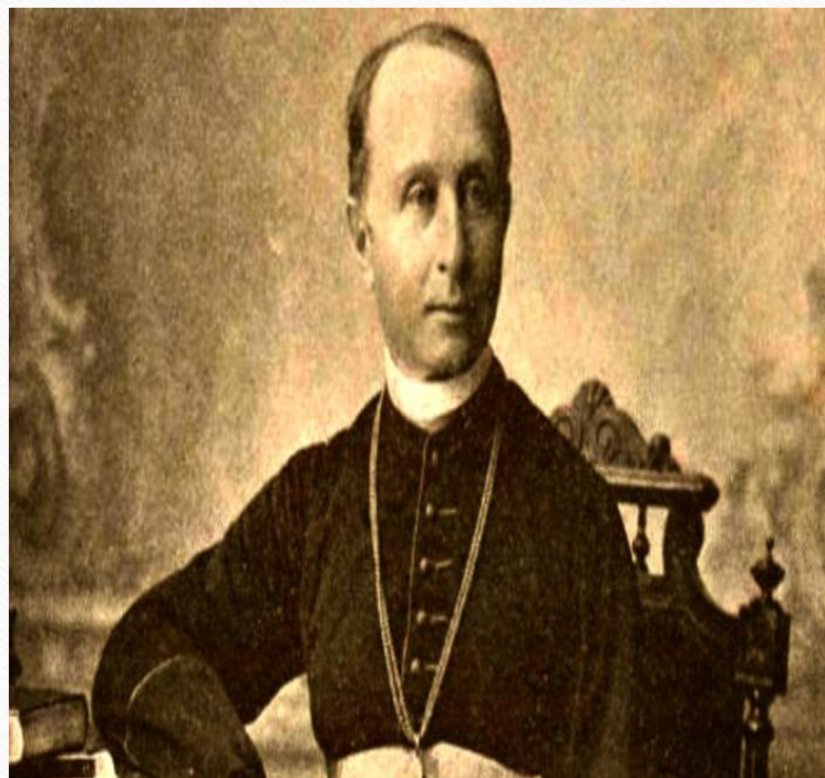
Ferdo Šišić (1869.-1940.)