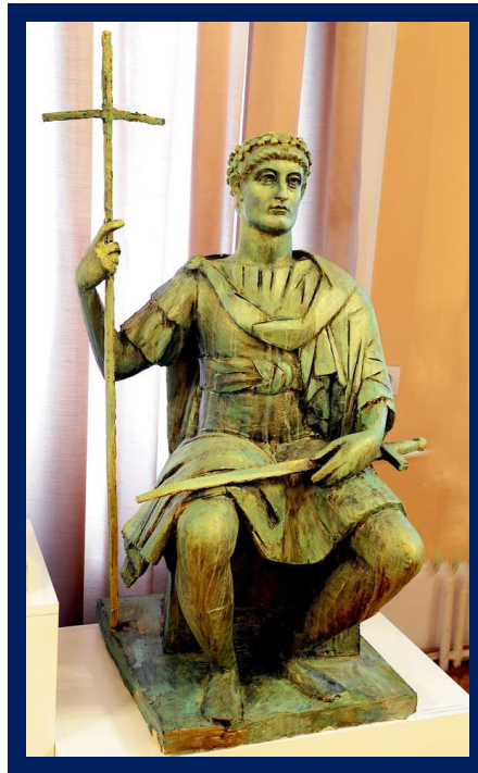
Konstantin I. Veliki