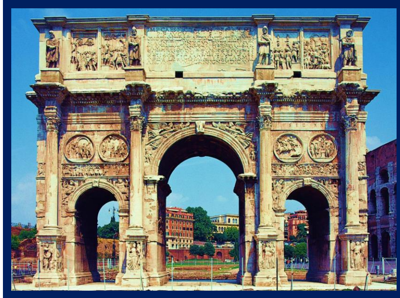
Mramorni slavoluk Konstantina I. Velikog u Rimu (podignut između 313. i 315.)

→ Konstantin razvija birokratski sustav; nova prijestolnica Konstantinopol