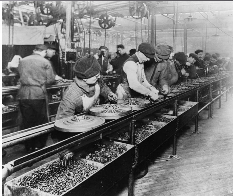
Foto: Početak pokretne trake, Fordova tvornica