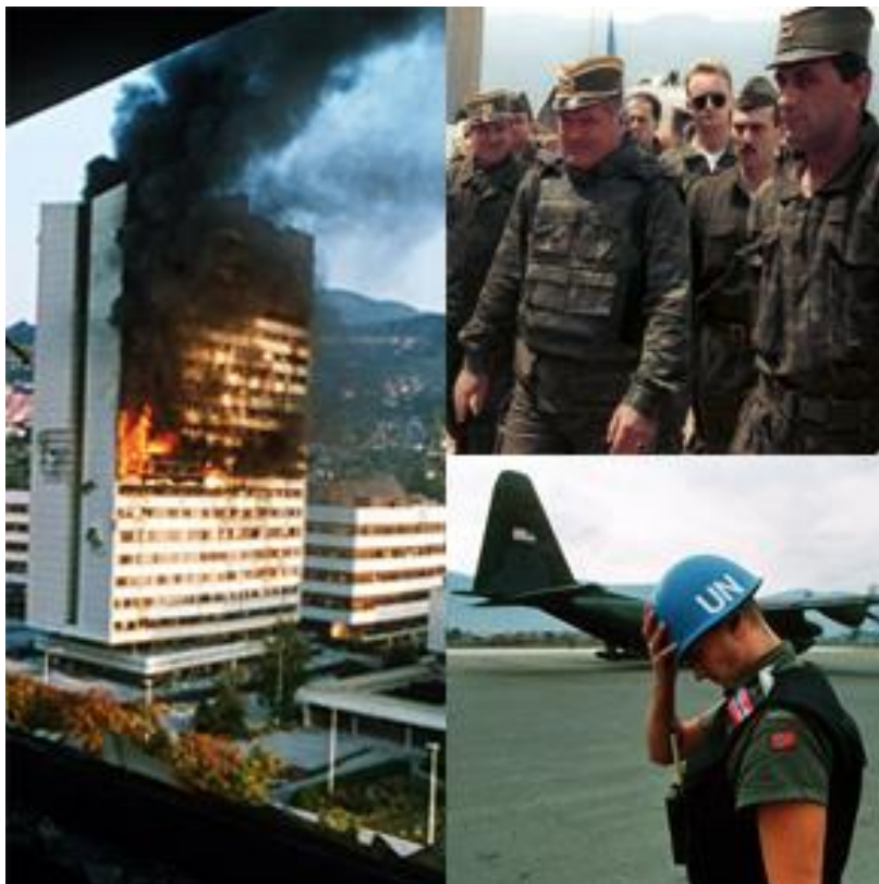
zgrada parlamenta BiH u plamenu

→ potkraj svibnja 1995. granatirana je Tuzla . U srpnju su agresori osvojili Srebrenicu , gdje su pobili nekoliko tisuća muslimana. Sarajevo je bilo izloženo velikom razaranju . HVO i Armija Bosne i Hercegovine istodobno su prodrli na teritorij koji je bio pod kontrolom Republike Srpske u zapadnoj i sjevernoj Bosni, približili su se i Banja Luci . Stanovništvo je počelo bježati u Srbiju. Hrvatsko - bošnjačke snage zauzele su 23% teritorija Republike Srpske , čija je vojska bila porażena . Primirje je potpisano 12. listopada 1995.