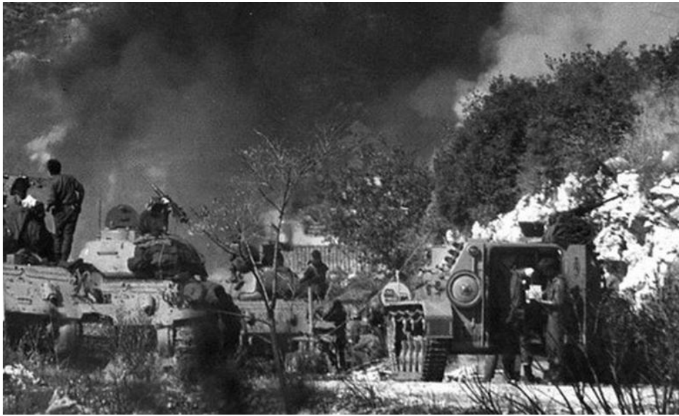
1.listopada 1991. počeo je rat u BiH (spaljeno selo Ravno)