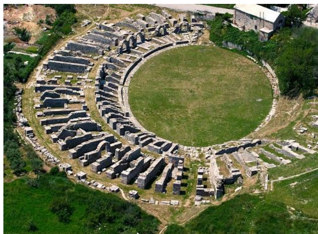
Ostatci rimskog amfiteatra u Solinu

● rimske ceste građene su za potrebe vojske i trgovine . Bile su široke do 5 metara . Uz ceste su bile postaje u kojima su putnici mogli prenoćiti i mijenjati konje . Unutar ruševina Salone pronađeni su natpisi, mozaici, skulpture, sarkofazi . Među tim ostacima nalaze se i natpisi s ilirskim imenima. Gradske ulice i forum bili su popločani . U većini radionica izrađivane su amfore i zemljane posude za spremanje vina, ulja, pšenice soljene ribe i dr.