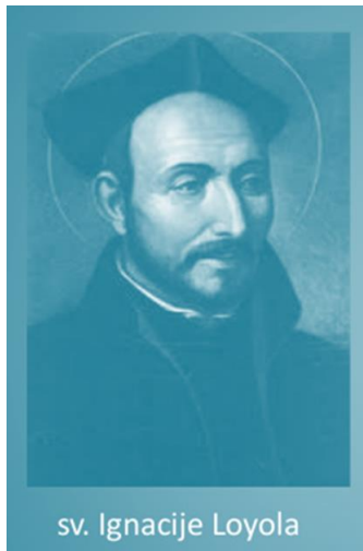
sv. Ignacije Loyola

→ sva nastojanja i mjere Katoličke Crkve protiv protestantizma i njegova širenja nazivamo protureformacijom . U protureformaciji i katoličkoj obnovi veliku ulogu imala je novoosnovana Družba Isusova . Taj je red 1534. u Parizu osnovao Ignacije Loyola . Isusovci su odgojem mladih ljudi i utjecajem na političke moćnike djelovali na širenje katoličke vjere . Gradili su bogato uređene crkve, brinuli su se za bolesne i siromašne, a osobito su poticali razvoj školstva u kršćanskom duhu