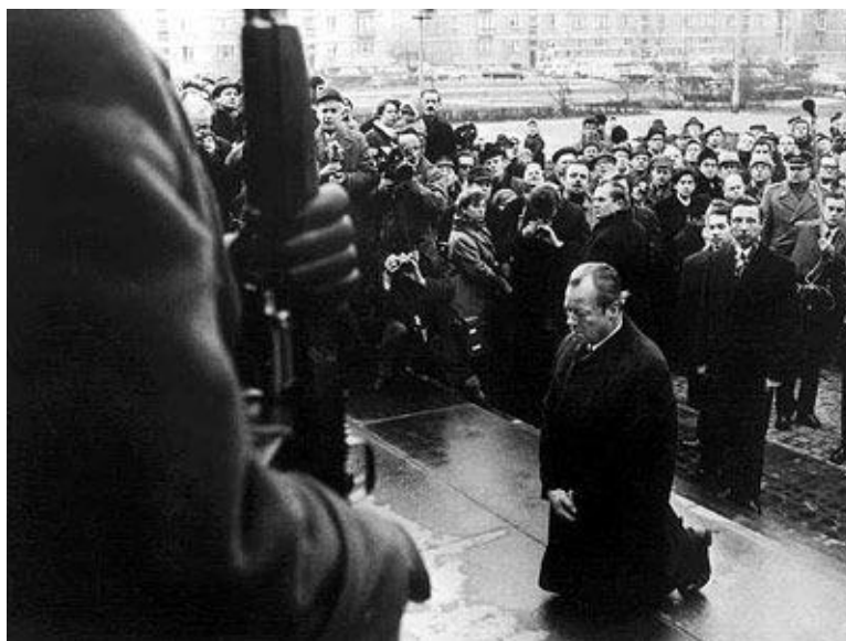
Willy Brandt u Varšavi 1970. kleči pred spomenikom žrtvama Varšavskog geta