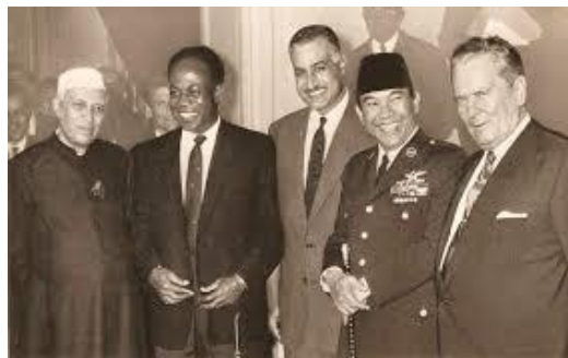
Predvodnici politike nesvrstanosti; Nehru, Kaunda, Naser, Sukarno i Tito