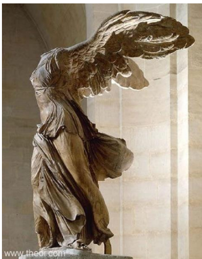
Slika 7. Nike sa Samotrake , 200. - 190. g. pr. Kr., mramor, Pariz

Nakon uspona Aleksandra Velikog započinje period helenizma . Umjetnici se zanimaju za točno određeni, emocionalno napeti trenutak. U djelima kiparstva može se uočiti nemir i dinamičnost s jakim kontrastima svjetla i sjene. Najpoznatiji takav primjer su skulpture Nike sa Samotrake i Laokoont i njegovi sinovi .