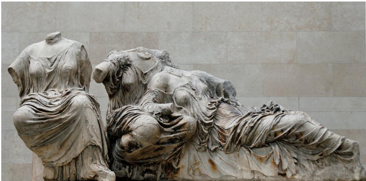
Slika 4. Tri parke, 438 - 432. g. pr. Kr., London

Najpoznatiju skupinu klasične skulpture predstavlja kiparska dekoracija Partenona . Pripisuje se Fidiji i njegovim učenicima. Sastojala se od 92 metope dorskog friza s prikazom borbe Giganata i Kentaura. Prednji je zabat prikazivao rođenje Atene, a stražnji njezino natjecanje s Posejdom. Likovi savršeno odgovaraju arhitektonskom okviru unutar kojeg se nalaze, a posebno se ističe izvanredna obrada draperija, koje se meko pripijaju i obavijaju tijela likova ostavljajući dojam mokre tkanine.