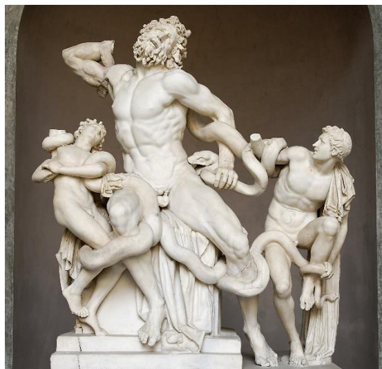
Slika 8. Laokoont i njegovi sinovi , kraj 2. st. pr. Kr., mramor, Rim