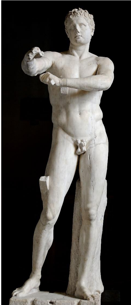
Slika 5. Lizip, Apoksimen , mramorna kopija, kraj 4. st. pr. Kr., Rim