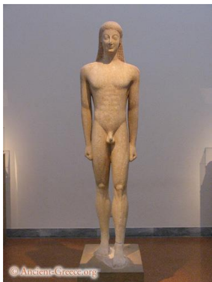
Slika 1. Kuros s Melosa, sredina 6.st.pr.Kr., Atena

Kore su kipovi mladih žena koje ljudi posvećuju božicama. One su odjevene, a u desnoj ruci drže cvijet ili voće. To su zatvoreni statični likovi koji, kao i kurosi, zauzimaju strogo frontalni stav. U kompoziciji je naglašena vertikala. Položaj tijela je ukočen, a samo tijelo zrcalno simetrično. Površina se ponekad rastvara stiliziranim naborima odjeće. Na licima se pojavljuje „ arhajski osmijeh “.