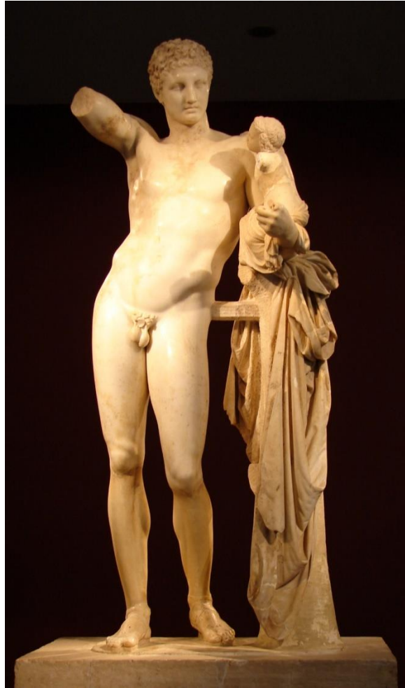
Slika 6. Praxitel, Hermes , 330. - 320. g. pr. Kr., mramor, Olimpija

Nakon uspona Aleksandra Velikog započinje period helenizma . Umjetnici se zanimaju za točno određeni, emocionalno napeti trenutak. U djelima kiparstva može se uočiti nemir i dinamičnost s jakim kontrastima svjetla i sjene. Najpoznatiji takav primjer su skulpture Nike sa Samotrake i Laokoont i njegovi sinovi .