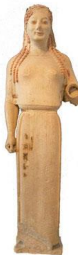
Slika 2. Kora 697, 530.god.pr.Kr., Atena

Oko 480. g. pr. Kr. u kiparstvu započinje klasična faza grčke umjetnosti. U ovoj fazi najčešći je motiv u skulpturi muško tijelo atletske građe. U prikazima ljudskih likova prisutna je idealizacija. Za razliku od arhajskih, klasične figure djeluju prirodno i životno. Likovi se često nalaze u položaju zvanom kontrapost . To je prirodan položaj tijela u kojem je težina tijela oslonjena na jednu nogu. Druga je noga lagano savijena i slobodna jer ne nosi težinu tijela. Da bi tijelo stajalo u ravnoteži, gornji je dio tijela neznatno nagnut u stranu, pa su ramena u kosom položaju. Jedan od najpoznatijih primjera ovakva načina prikazivanja je Polikletov Dorifor nastao oko 450. – 440. g. pr. Kr. Poliklet je postavio i kanon , pravilo prikazivanja ljudskog tijela po kojem omjer između duljine tijela i veličine glave iznosi 1:7.