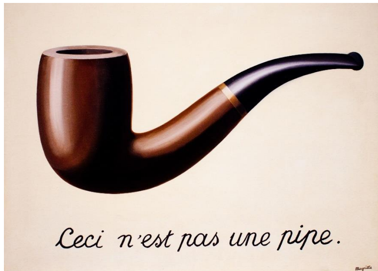
Slika 3. Rene Magritte, Ovo nije lula , ulje na platnu, 1929., Chicago

Nesvakidašnja pojava, velika slavna nadrealistička zvijezda bio je Salvador Dali . Svojim istupima u javnosti, ekscentričnom pojavom i vezom sa svojom izabranicom Galom, Dali je od vlastite osobe stvorio mit i postao jedan od prvih likovnih umjetnika čija je slava nalikovala slavi medijske zvijezde. U slikarstvu ostaje vjeran naturalistički preciznom prikazivanju detalja smještenih u nestvarne kontekste.