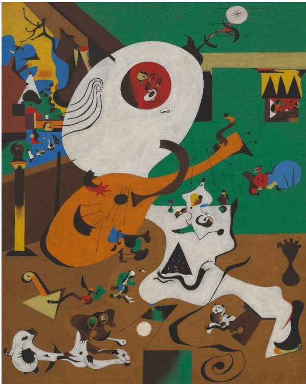
Slika 1 Joan Miro, Nizozemski interijer I , ulje na platnu, 1928. godine, New York

Najpoznatiji predstavnik apstraktnog trenda u nadrealizmu bio je Španjolac Joan Miro (1893. – 1983.), iako je sam odbacivao ideju o tome da su njegove slike apstraktne. Na slikama se pojavljuju fantastični oblici snažnih boja i organskih formi, koji podsjećaju na dječje crteže. Ovi znakovi i simboli proizilaze iz redukcije stvarnih motiva.