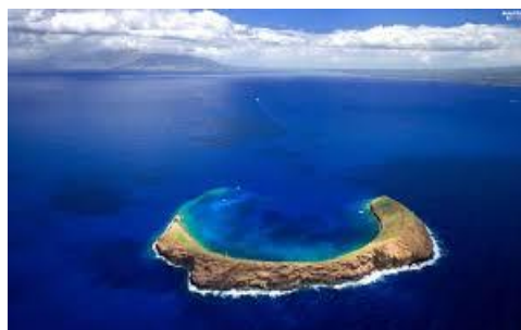
Slika 1. Atol