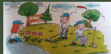
ŠUMA I PARK