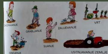
ORANICA I VRT