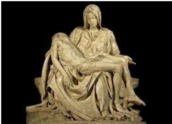
Pieta, Michelangelo, klasična skulptura

1. KIP ILI SKULPTURA je kiparsko djelo koje je trodimenzionalno, stoji slobodno u prostoru i vidimo ga sa svih strana.