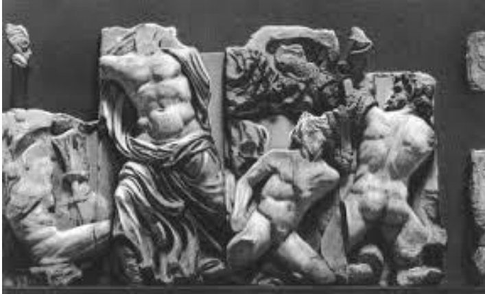
Visoki ili duboki reljef

Niski ili ucrtani reljef nema nikakvih izbočina, nego udubljenja ucrtana u ploču, sve su plohe ravne i sličan je crtežu.