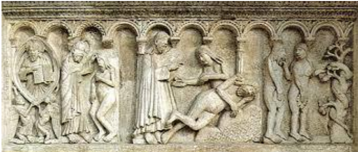
Srednji ili plitki reljef