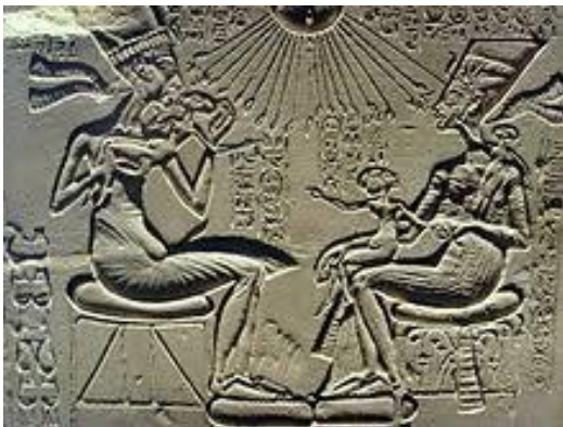
Niski ili ucrtani reljef

3.MOBIL je kiparska djelo koja se može pokretati. To je konstrukcija od laganih materijala: žica, plastika, spužva, papir i slično. Mobil se objesi na strop i pokreće strujanjem zraka. Može imati i ugrađen motor za pokretanje. Može također samostalno stajati u prostoru i trodimenzionalan je. Prve mobile radio je američki umjetnik Alexander Calder . Mobile susrećemo u vidu suvremenih visilica ili igračaka iznad dječijeg krevetića.