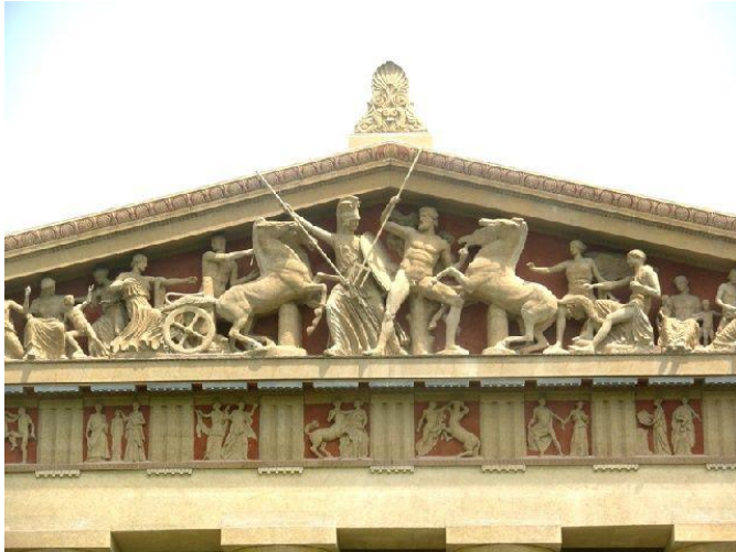
Skladan odnos arhitekture i kiparstva