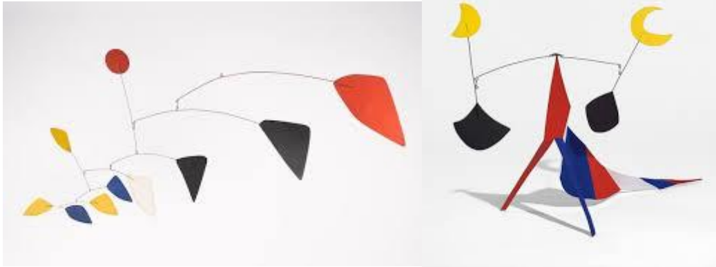
Mobil, Alexander Calder