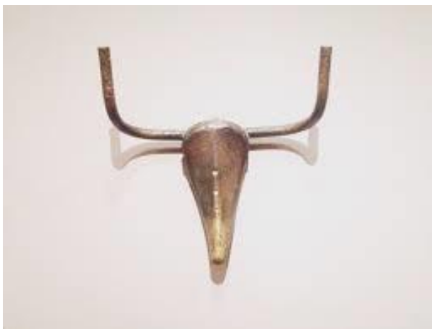
Picasso, Glava bika, READY-MADE

Dadaisti u književnost Tristan Tzara, Andre Breton, francuski književnik.