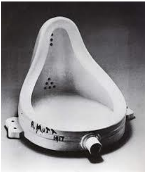
Marcel Duchamp, Pisoar

Dadaisti u svojim djelima nastoje prikazati da sve utvrđene vrijednosti, estetske i moralne, u ratu gube smisao. Njihova djela su apsurdna i nastaju upravo iz tog razloga da takva budu jer je u ratu sve apsurdno pa i živjeti. Glavni predstavnik, jedan od najrevolucionarnijih umjetnika 20. stoljeća je MARCEL DUCHAMP . Izmislio je READY-MADE (već napravljeno). Takva djela nastaju po zakonu slučajnosti od već gotovih predmeta za svakodnevnu uporabu koji se stavljaju u drugi ambijent (galeriju) i u drugom ambijentu ih gledamo na drugi način, kao umjetnički eksponat.