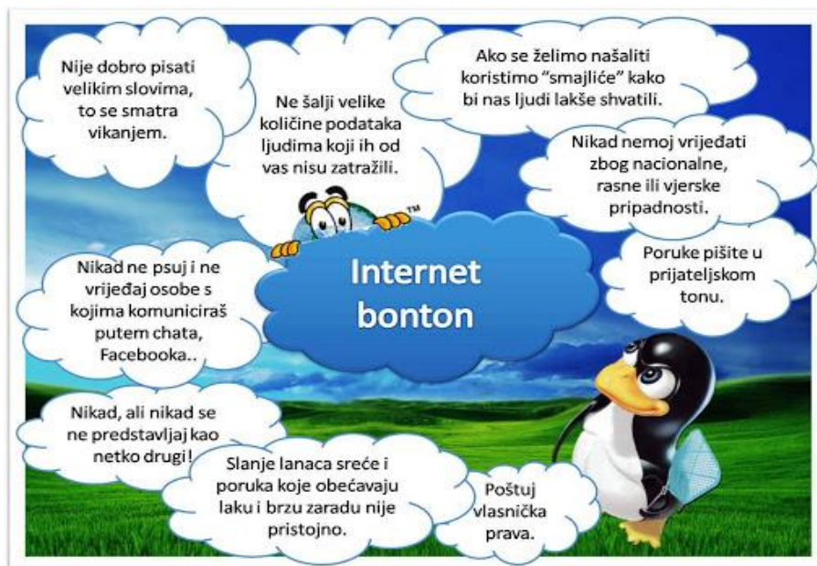
Primjer umne mape s pravilima ponašanja na internetu

Napravi umnu mapu s pravilima komunikacije putem elektroničkih medija, možeš se poslužiti i internetom. Ako imaš priliku, stavi svoj uradak na vidno mjesto kao podsjetnik.