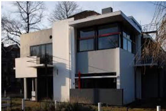
Utjecaj DE STIJLA na arhitekturu

Ameriku i dalje razvija svoju apstrakciju usklađenu s glazbom. Pod utjecajem brzog života, usitnjava svoje kvadrate i stvara više ritma i dinamike, tako da te slike odgovaraju tlocrtu New Yorka ( slika Broadway Boogie Woogie). Skupina DE STIJL okupljala je mnoge umjetnike i utjecala je na razvoj moderne arhitekture 20. St., koja se temelji na geometrijskim oblicima. Utjecali su na razvoj modernog dizajna, na dizajnerski namještaj, a 60-tih godina Mondrianov uzorak bio je popularan i u modi, pa sve do danas.