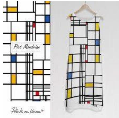
Utjecaj na modu