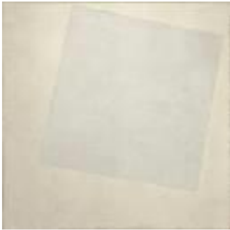
Maljević, Bijeli kvadrat na bijeloj podlozi

krugu i na crnoj, crvenoj i bijeloj boji. Ovakva umjetnost je minimalistička ( lišena svega nepotrebnog). Najpoznatija djela su „ Bijeli kvadrat na bijeloj podlozi“ i „Crni kvadrat na bijeloj podlozi“.