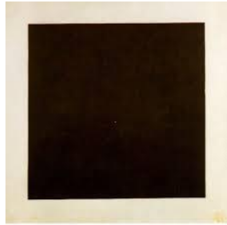
Crni kvadrat na bijeloj podlozi

Nizozemski slikar Piet Mondrijan bavio se geometrijskom apstrakcijom. Godine 1917. Osnovao je umjetničku skupinu DE STIJL . Istražuje plastičnost oblika , nove spoznaje volumena. Smatra da u umjetnosti treba izraziti harmoniju pomoću geometrijskih tijela i to u 3d obliku. Njegova umjetnost je minimalistička. Kao i Maljević bazirao se na kvadratu, kao savršenom obliku i harmoniju vidi u pravom kutu.