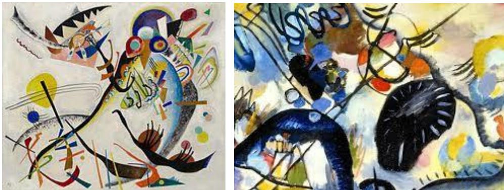
Vasilij Kandinski, apstraktne slike

Utemeljitelj čiste apstrakcije je ruski slikar Vasilij Kandinski . Osnovao je skupinu DER BLAUE REITER ( Plavi jahač) 1910. godine u München. Kandinski se bavio i glazbom koja je također apstraktna umjetnost i povezivao je svoje slike i glazbu. Želio je izraziti čisti osjećaj pomoću boje i zvuk.