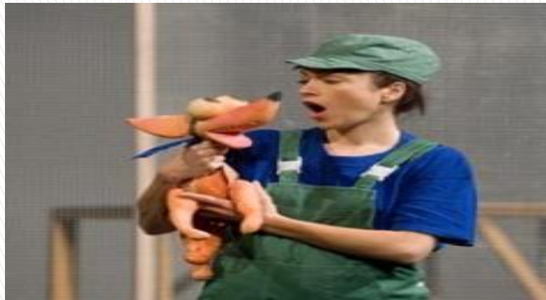
I ti ljubav nekom daj