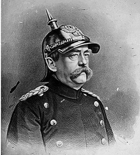
Otto von Bismarck