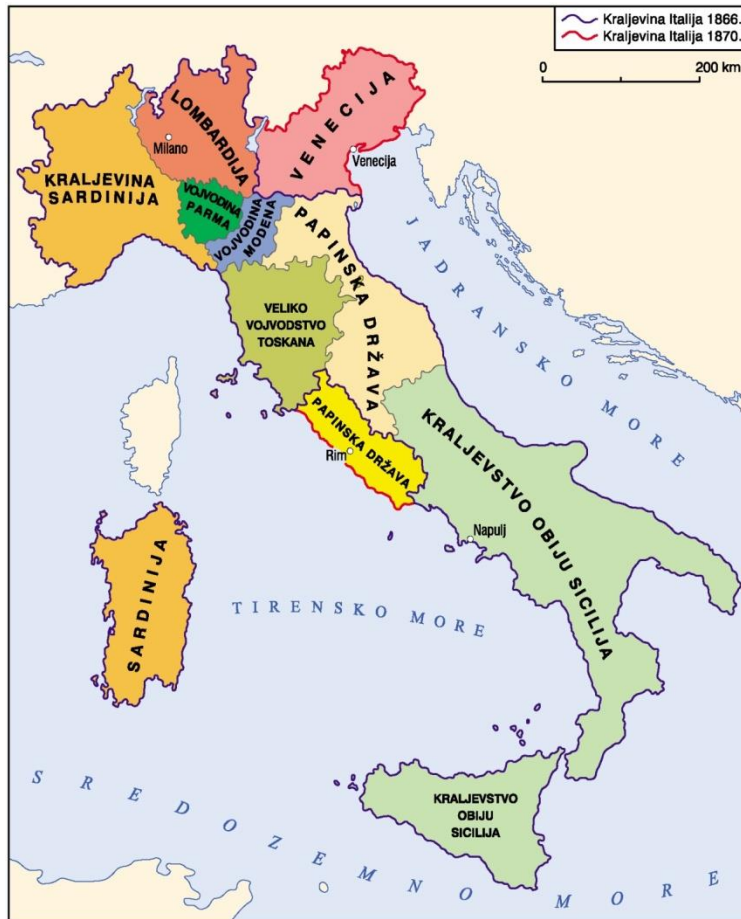
Talijanske države prije ujedinjenja