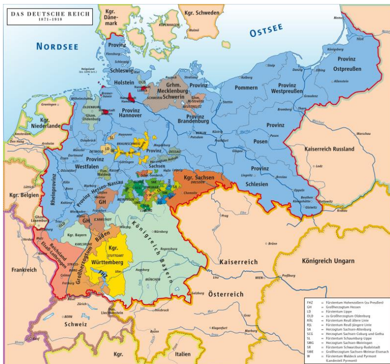
Njemačko Carstvo (1871. - 1918.)