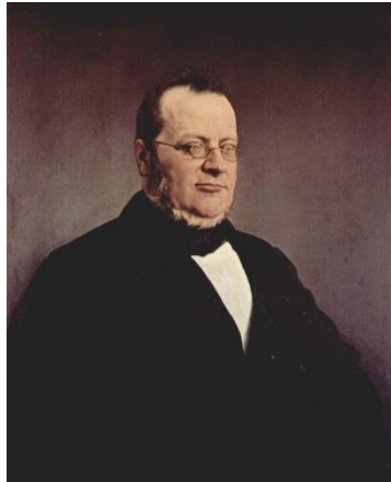
Camillo Cavour - premijer Pijemonta