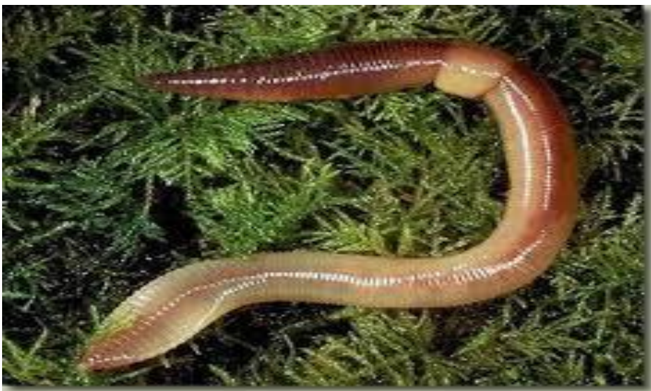
Slika: Gujavica- Lumbricus terrestris